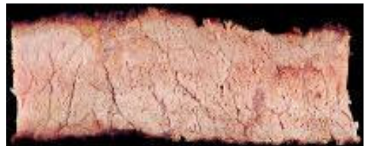
VERY WELL DONE / МНОГО ИЗПЕЧЕНО Приблизителна температура в центъра 82°C