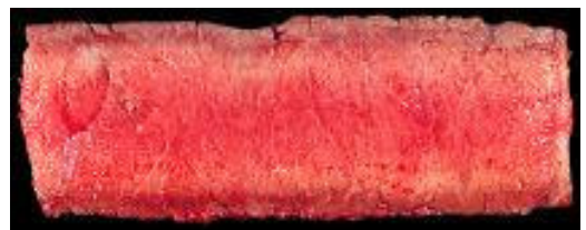
RARE / НЕДОПЕЧЕНО Приблизителна температура в центъра 60°C