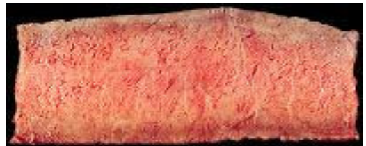
MEDIUM / СРЕДНО ИЗПЕЧЕНО Приблизителна температура в центъра 71°C