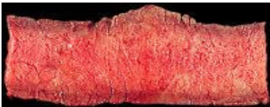
MEDIUM RARE / СРЕДНО НЕДОПЕЧЕНО Приблизителна температура в центъра 63°C