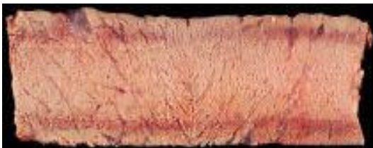
WELL DONE / ДОБРЕ ИЗПЕЧЕНО Приблизителна температура в центъра 77°C